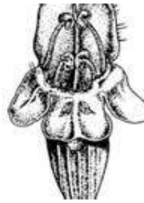
Afirmção 8 B