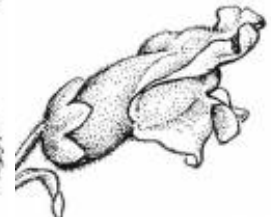
Afirmção 9 B