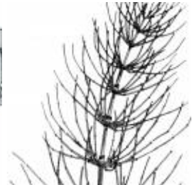
Afirmção 4 A