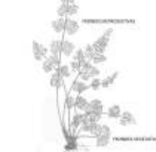
Afirmção 2 B