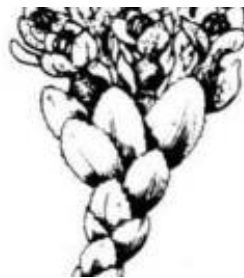
Afirmação 7 A