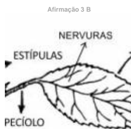
Afirmação 3 B