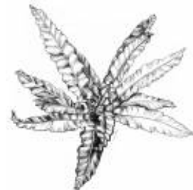
Afirmção 3 A