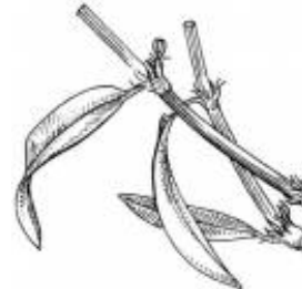
Afirmção 10 A