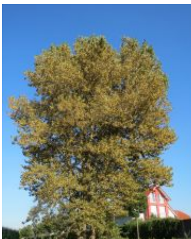
Populus x canadensis