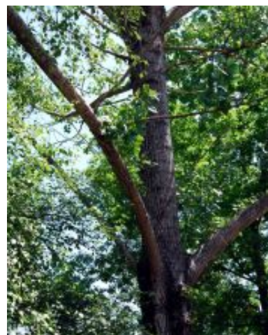
Populus x canescens