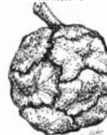
Afirmção 2 A