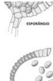
Afirmção 1 A