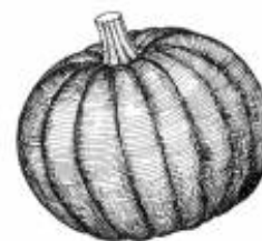
Afirmção 8 B