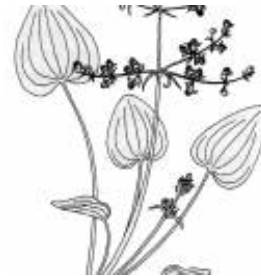
Afirmção 1 B