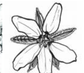
Afirmção 5 A