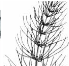
Afirmção 6 A