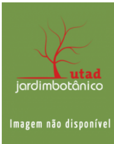
Deutzia x elegantissima