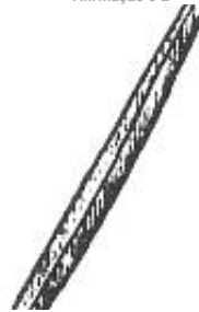
Afirmção 7 A