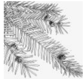
Afirmção 7 A