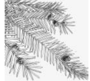
Afirmção 5 A