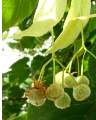
Tilia x europaea