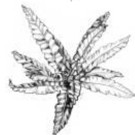
Afirmção 3 A