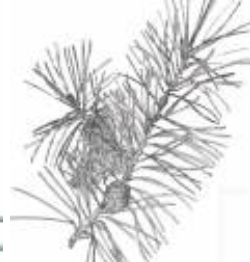
Afirmção 3 B