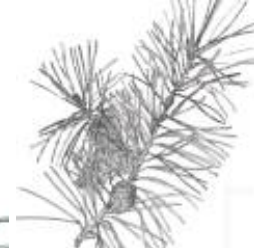
Afirmção 3 B