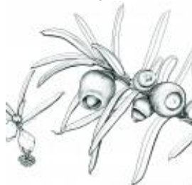
Afirmção 4 A