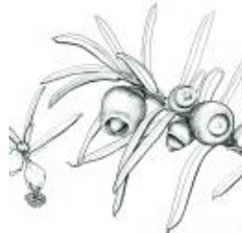
Afirmção 4 A