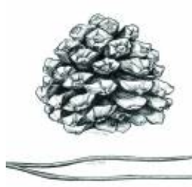
Afirmção 3 B