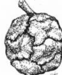
Afirmção 2 A