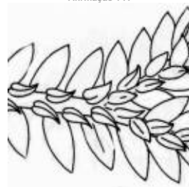
Afirmção 2 A