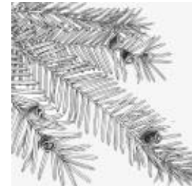
Afirmção 5 A