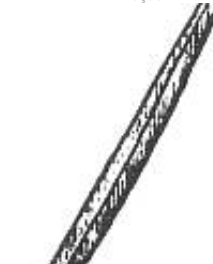
Afirmção 4 B