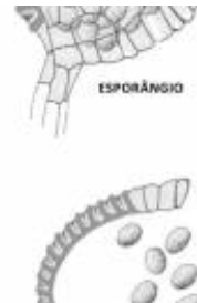
Afirmção 1 A