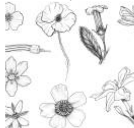
Afirmção 5 B