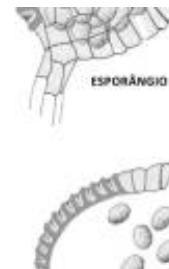
Afirmção 1 A