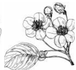
Afirmação 5 B