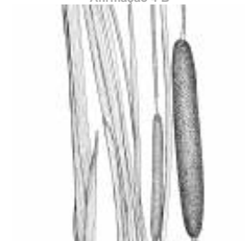
Afirmção 12 B