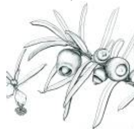
Afirmção 5 A