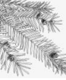
Afirmção 4 A