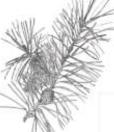
Afirmção 3 B