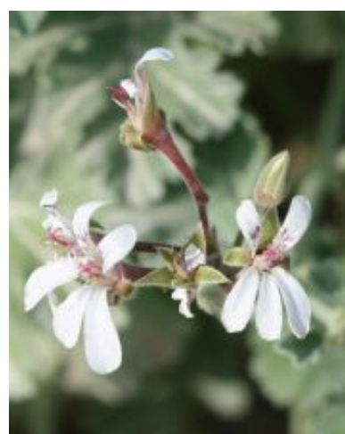
Pelargonium x fragrans