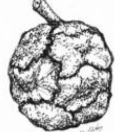
Afirmção 2 A