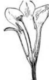
Afirmação 12 B

Folhas com nervação peninérvea ou uninérvea, sistema radicular não fasciculado.