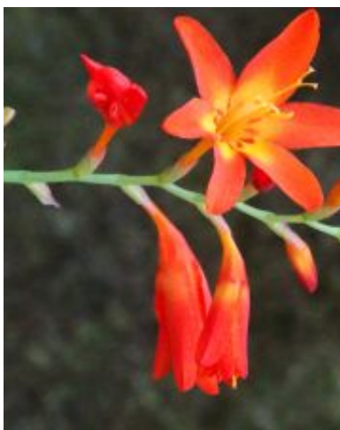
Crocosmia x crocosmiiflora