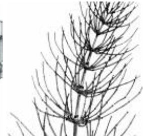
Afirmção 4 A