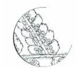
Afirmação 8 B