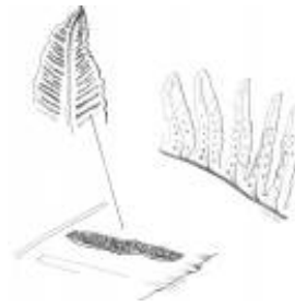
Afirmação 6 B