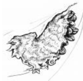
Afirmação 8 B