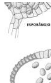
Afirmção 1 A