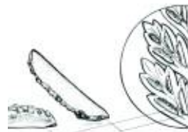
Afirmção 11 A

Soros sem qualquer indúsio cobrindo-os total ou parcialmente.