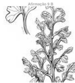
Afirmção 9 B

Fronde com o limbo composto por 4 folíolos, sustentada sobre um longo pecíolo filiforme; plantas que vivem em charcos temporários.