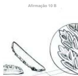
Afirmção 10 B