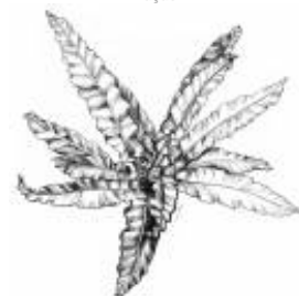
Afirmção 3 A