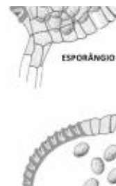
Afirmção 1 A