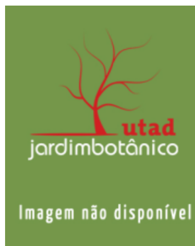
Cestrum x cultum