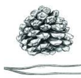
Afirmção 3 B