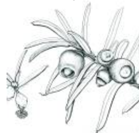
Afirmção 4 A