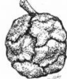
Afirmção 2 A