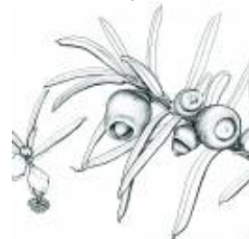
Afirmção 4 A