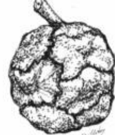
Afirmção 2 A