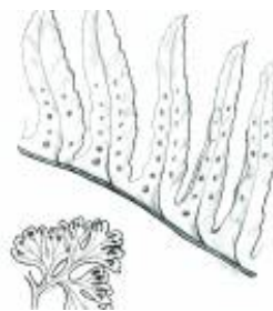
Afirmação 6 B