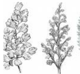
Afirmção 3 B