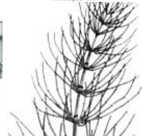
Afirmção 5 A