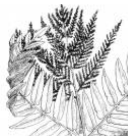
Afirmação 6 A