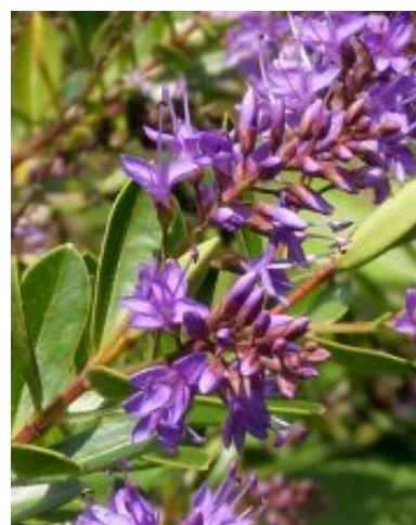
Hebe x andersonii