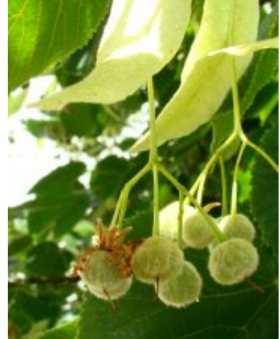
Tilia x europaea