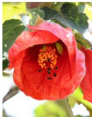
Abutilon x hybridum