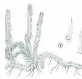
Afirmção 4 B