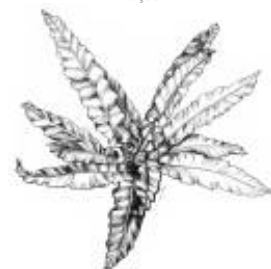
Afirmção 3 A