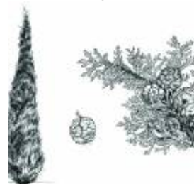
Afirmção 5 B