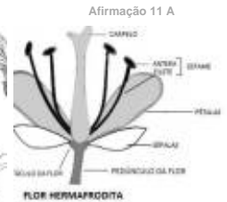
Afirmação 11 A