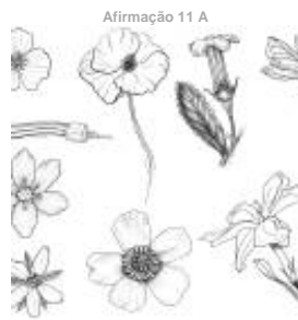
Afirmação 11 A

Plantas que formam frutos (carpelos encerrados formando pistilos); flores unissexuais ou hermafroditas, não dispostas em estróbilos (as femininas não formam pinhas); as folhas não estão inseridas sobre braquiblastos.