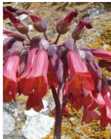
Kalanchoe x houghtonii