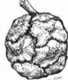
Afirmção 2 A