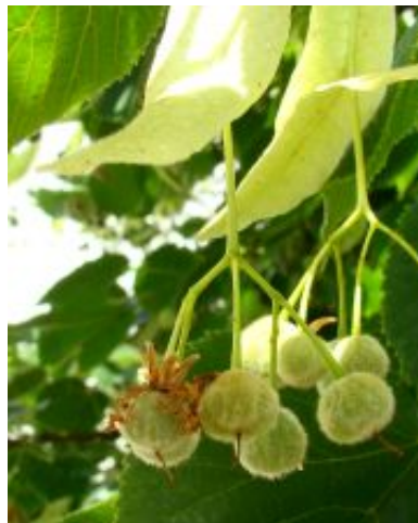
Tilia x europaea