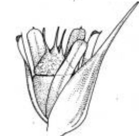
Afirmção 11 B